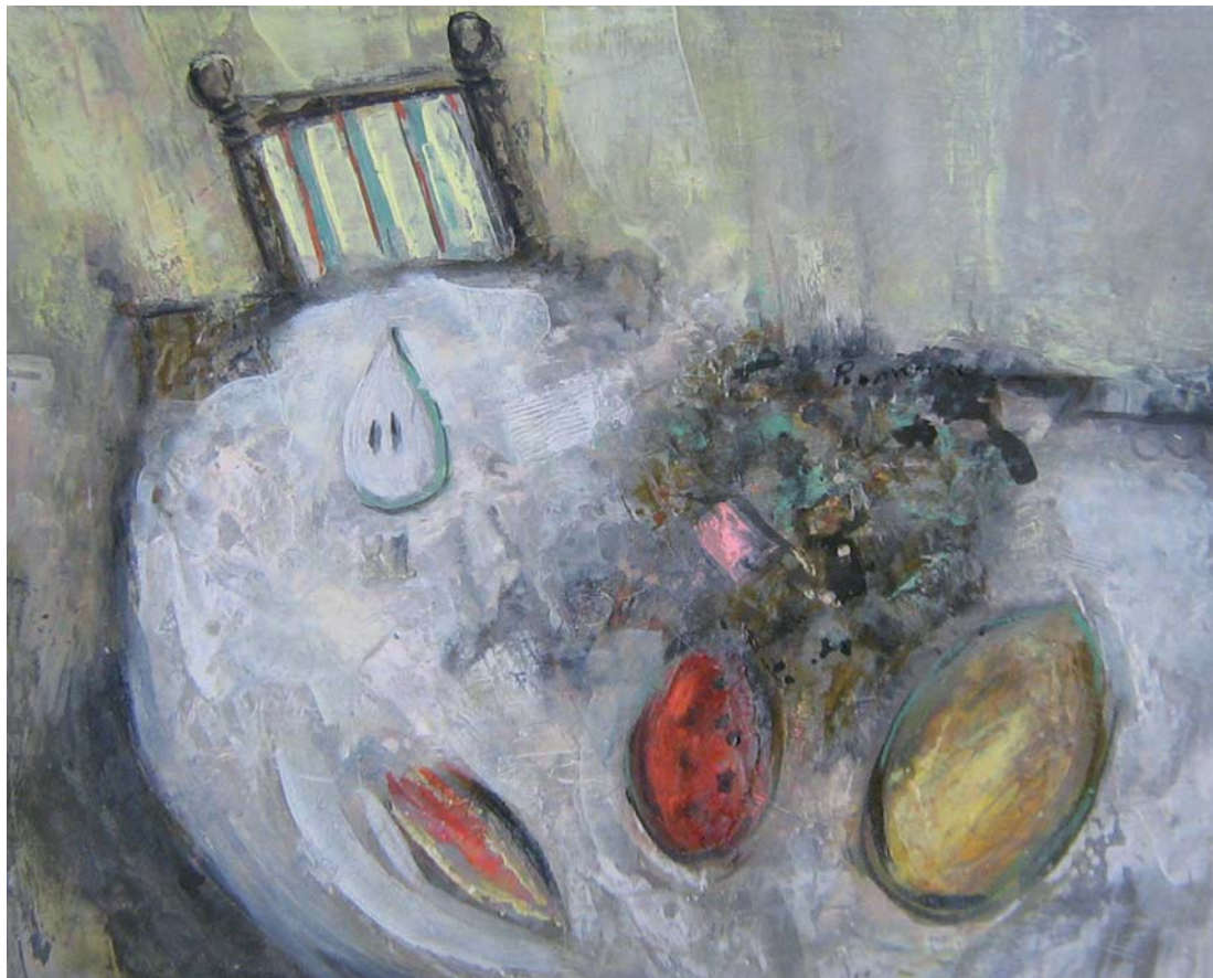
"Bodegón". Óleo sobre tabla 46 x 33 cm.