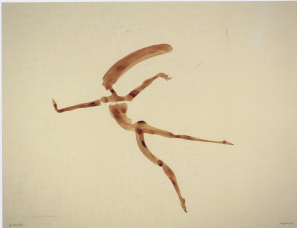
No pasarán Tinta sobre papel 50 x 65