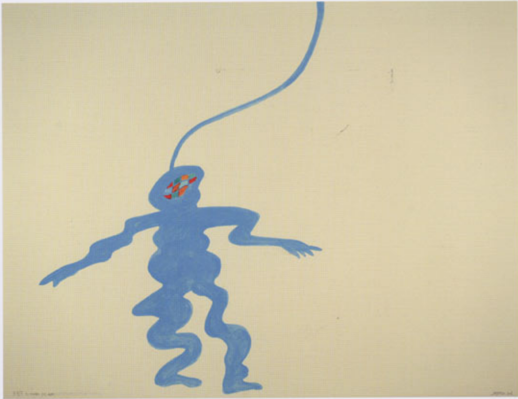
Viaje al fondo del mar Tinta sobre papel 50 x 65